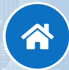
Residencial nivel alto